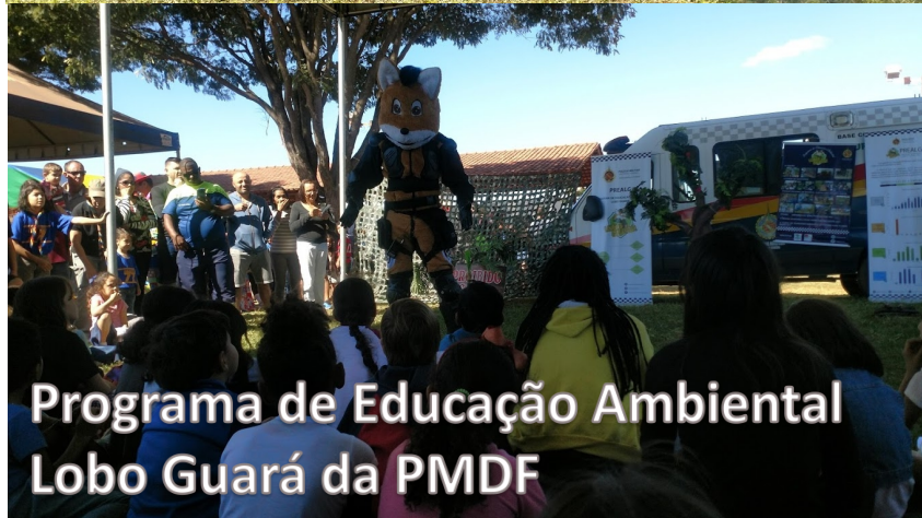
Programa de Educação Ambiental Lobo Guará da PMDF