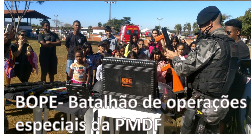
BOPE- Batalhão de operações especiais da PMDF