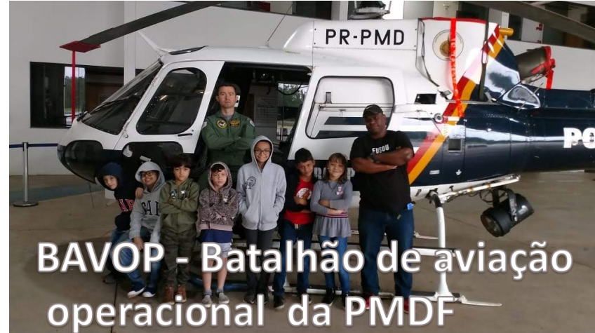
BAVOP - Batalhão de aviação operacional da PMDF